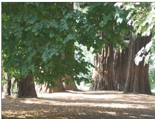
Enige sequoia's in Parc de Mariemont