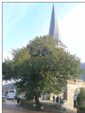
De 1.000 jarige taxus van Offranville