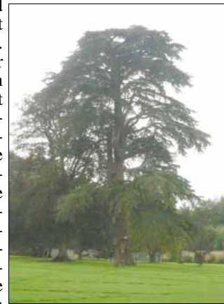
Indrukwekkende Libanonceder in Tourville sur Arques