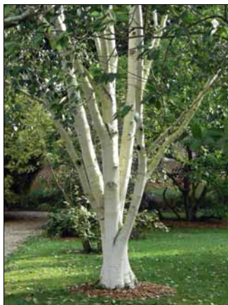
Papierberk van Bosmelet

boomsorten en in beperkte mate weer de taxushagen.