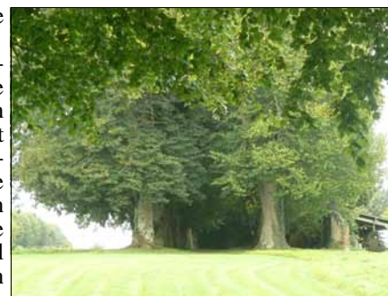
Majestueuze lindenlaan van Bosmelet

Chateau de Bosmelet ligt op het vlakke land bij Auffay . Het romantische kasteel dateert uit 1632 en de tuinen uit de periode Louis XIII. De tuinen rondom het kasteel met een ronde vijver en pergola's omvatten 900 variaties aan bloemen en groenten. Het complex is sinds 1632 bezit van de familie Bosmelet. Op het kasteel bestaan overnachtingsmogelijkheden en er worden congressen en workshops georganiseerd. Tijdens de oorlog bouwden Duitsers er een V1 installatie onder beschutting van twee oude volumineuze tamme kastanjabomen met het gevolg dat de Engelsen niet alleen de installatie vernietigden maar ook het kasteel grotendeels in puin bombardeerden. Het kasteel werd herbouwd en een deel van het betonnen lanceerplatform is nog aanwezig. In de tuinen