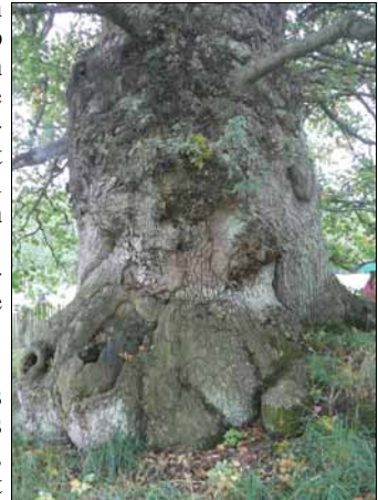
Solitaire eik van Beauval en Caux

Midden in een weiland van een Normandische herenboer bij Beauval en Caux staat een nog zeer gezonde, alleenstaande monumentale eikenboom omgeven door een bescheiden houten hekwerkje. Het is de mooiste eik die ik ooit heb gezien. De leeftijd wordt geschat op 800 tot 1.000 jaar en de omtrek is rond 9 m. Een kleine holle ruimte werd eens als hondenhok gebuikt. Een zijtak brak ooit af. In 1892 beschreef Henri Gadeau de Kerville de boom. De plek is een beetje moeilijk te vinden.