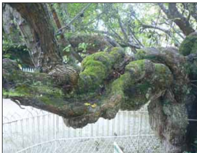
Imposante tak van de meidoorn in Bouquetot