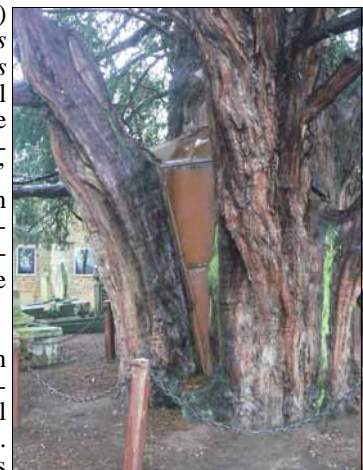
Een taxus in La Haye de Routot

Frankrijk kent veel eeuwenoude bomen waarvan de monumentale voorkomen onder 'Arbres remarquable de France'. Hieronder bevinden zich veel taxussen. Eeuwenoude monumentale taxussen (Fr. l'if) zijn indrukwekkend maar ook het taxushout is altijd prachtig. Taxushout is zwaar en massief, maar ook elastisch, het werd gebruikt om bogen van te maken. Pijlen en speren werden ingesmeerd met het giftige sap van de taxus (taxine). Het sap is een onderdeel van anti-kanker medicijnen, waarbij taxol de groei van kankercellen vertraagt (Amerikaanse ontdekking van 1960 en verder onderzoek aan de Universiteit van Gif-sur-Yvette in 1980). Docetaxel (handelsnaam Taxotere) is van groot belang bij de behandeling van uitgezaaide borstkanker. Voor christenen is de taxus een symbool van de verbinding tussen hemel en aarde en wordt op grote schaal aangeplant rond kerken en begraafplaatsen vanwege zijn lange levensduur en wordt door de