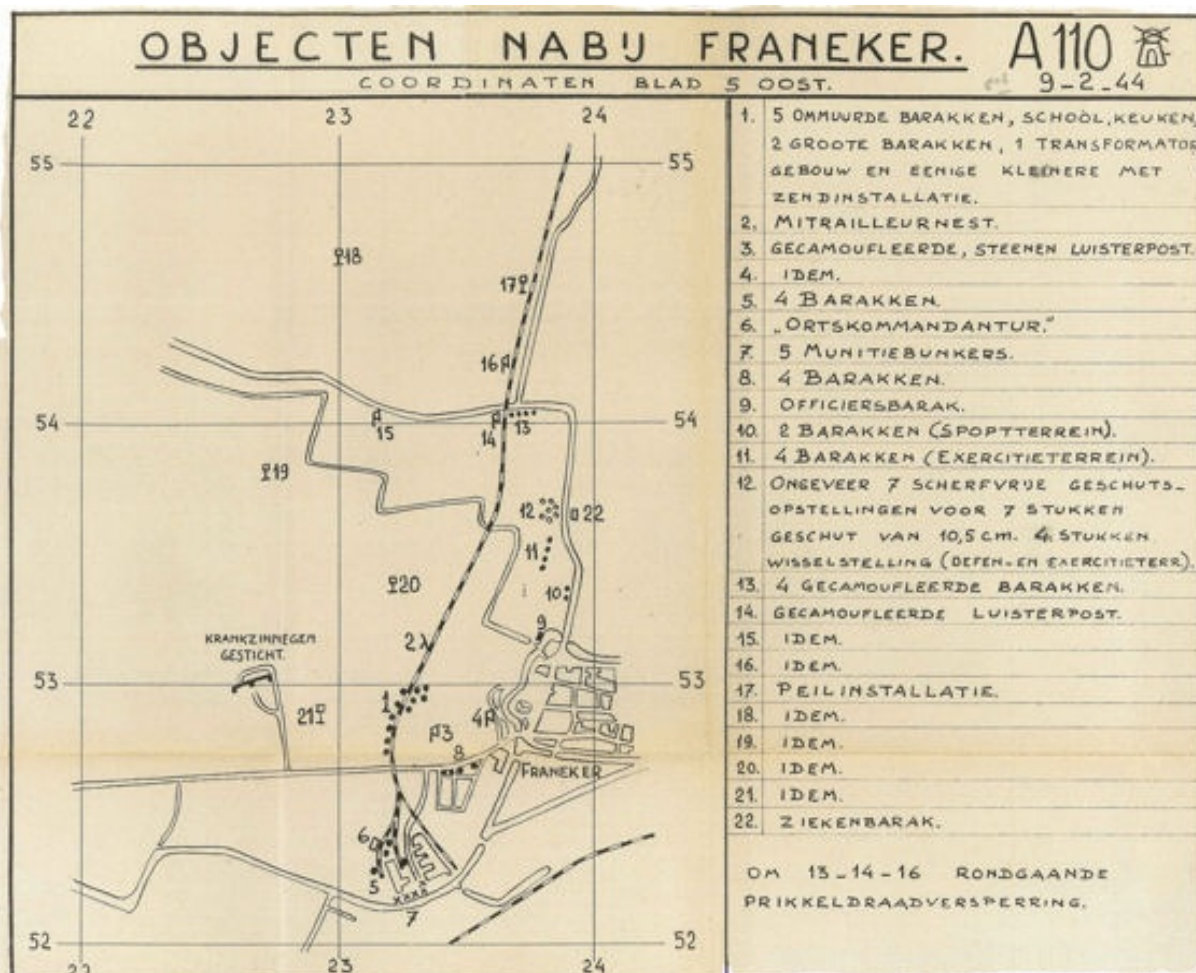
Afb. 2. Duitse verdedigingswerken rond Franeker.