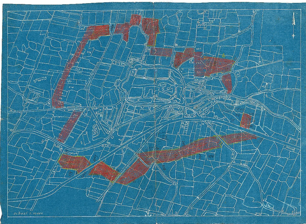
Afb. 3. Duitse mijnenvelden rond Franeker. De mijnenvelden zijn in vaalrood aangegeven.

Boer Lyklema op de boerderij tussen Langhuis en Lutjelollum gaf meerdere onderduikers onderdak. Bij